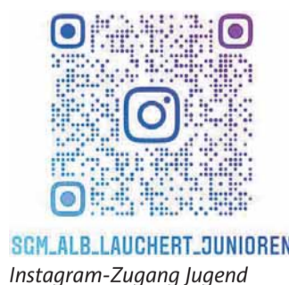
SGM_ALB_LAUCHERT_JUNIOREN Instagram-Zugang Jugend