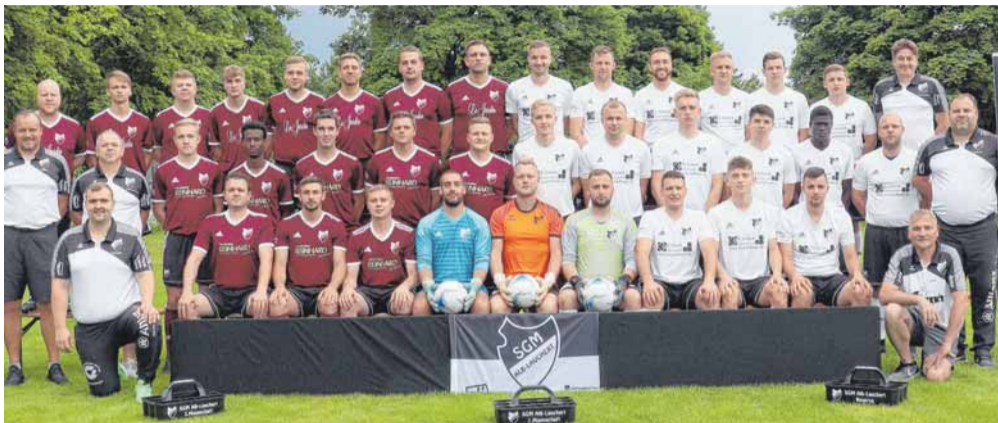
Die Aktiven der SGM Alb-Lauchert spielten bis zum Corona-Saisonabbruch eine überragende Rolle in der Kreisliga A 2 Donau. Mit 32 Punkten gehen sie als Tabellenführer in die am 6. März beginnende Saisonfortsetzung. Und zwar mit einem Heimspiel ab 15 Uhr gegen Abstiegskandidat SPV Sigmaringen Türk Gücü. Da sollte nichts anbrennen.