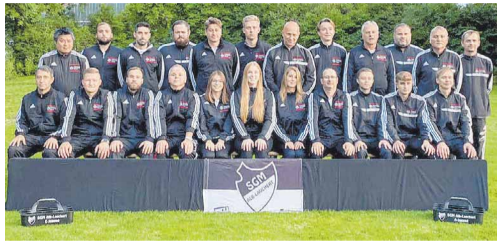
Gleich 23 Trainerinnen und Trainer betreuen die sieben SGM-Jugendmannschaften von den Bambini bis zu den A-Jugendlichen. Sie sorgten mit ihren Teams für eine überragende Saison 2019/20, als es Meistertitel für die B- und C-Junioren gab, ebenso für die jeweils beiden D- und E-Junioren-teams. Sechs Jugendtitel in einer Saison! Mehr geht nicht.