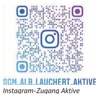
SGM_ALB_LAUCHERT_AKTIVE Instagram-Zugang Aktive

1:0 FÜR MENSCH UND REGION. www.gewgmbh.de Strom | Wasser | Wärme